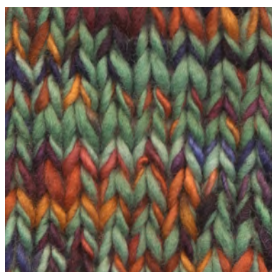
MCM-6554 / MCM-2302