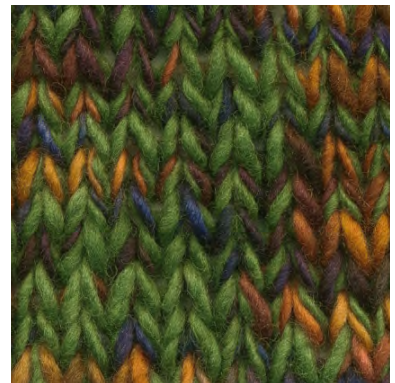
MCM-6554 / MCL-2364