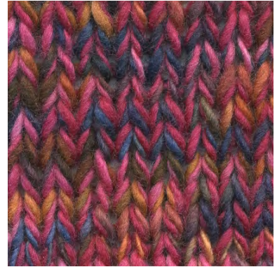
MCM-6554 / MCL-5003