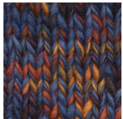
MCM-6554 / MCM-2412