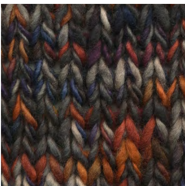
MCM-6554 / MCL-7311