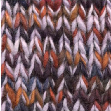
MCM-6554 / MCL-2615

Manos del Uruguay Wool Clasica - SEVENTIES MCM-6554 100% fairtrade handgesponnen wol garen mix van semi uni en melange kleuren.