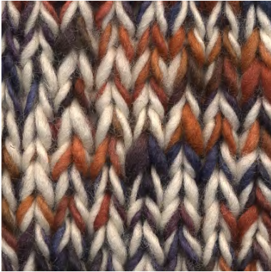
MCM-6554 / MCL-2800

Manos del Uruguay Wool Clasica - SEVENTIES MCM-6554 100% fairtrade handgesponnen wol garen mix van semi uni en melange kleuren.