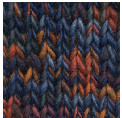
MCM-6554 / MCM-7073

patronen wol en materialen voor breiers met pit