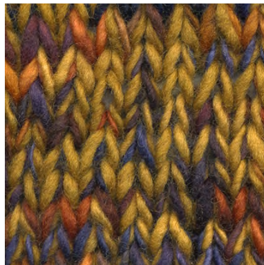
MCM-6554 / MCL-2264