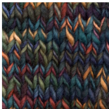
MCM-6554 / MCL-7325