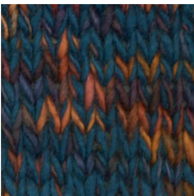
MCM-6554 / MCL-2444