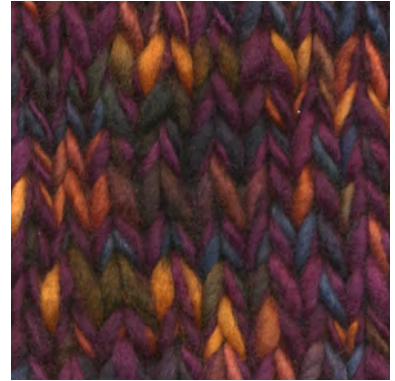
MCM-6554 / MCL-2665