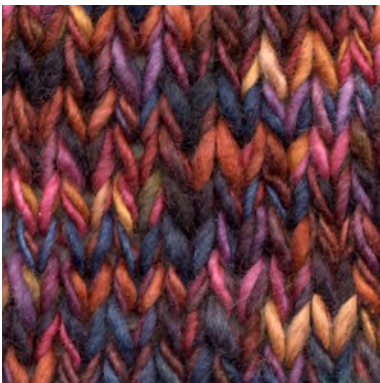
MCM-6554 / MCL-7032