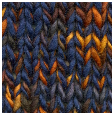
MCM-6554 / MCL-2450