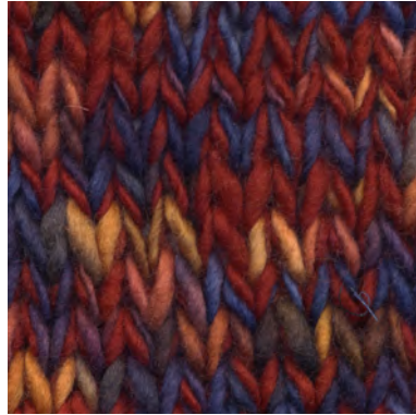
MCM-6554 / MCL-2106