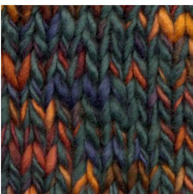
MCM-6554 / MCM-2370