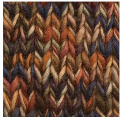
MCM-6554 / MCL-8891