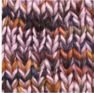
MCM-6554 / MCL-2603