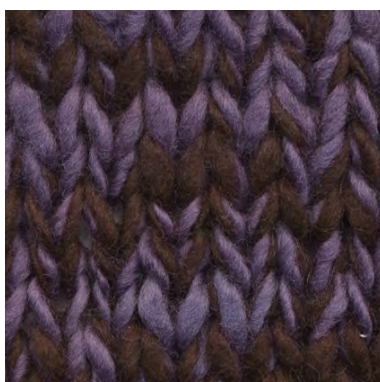
MCL-2247 / MCM-2672