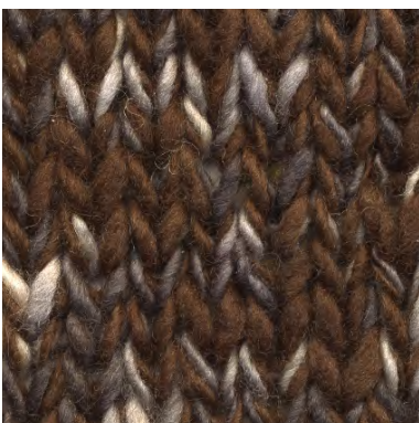
MCL-2247 / MCL-7311