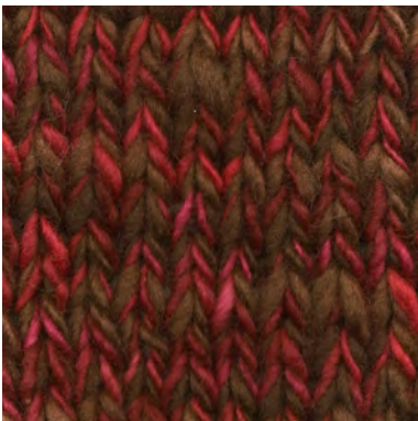
MCL-2247 / MCL-6422