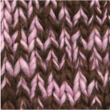
MCL-2247 / MCL-2603

Manos del Uruguay Wool Clasica - CHESTNUT MCL-2247 100% fairtrade handgesponnen wol garen mix van semi uni en melange kleuren.