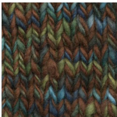
MCL-2247 / MCM-7325