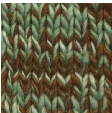
MCL-2247 / MCM-2302