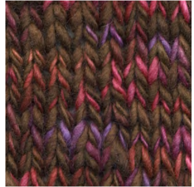
MCL-2247 / MCL-7032