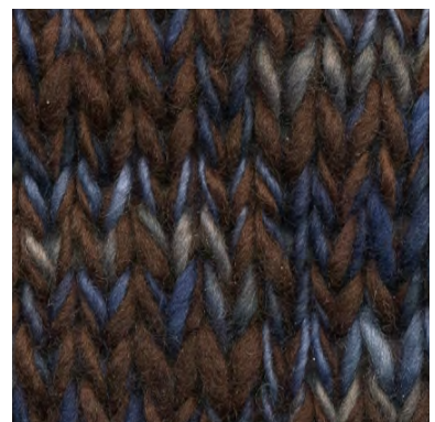
MCL-2247 / MCM-7073

patronen wol en materialen voor breiers met pit