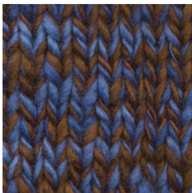
MCL-2247 / MCM-2412