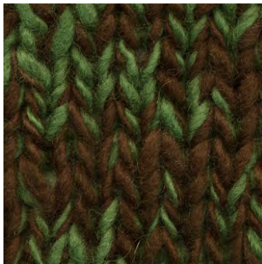
MCL-2247 / MCL-2364