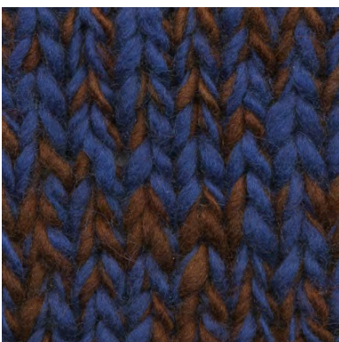
MCL-2247 / MCL-2450