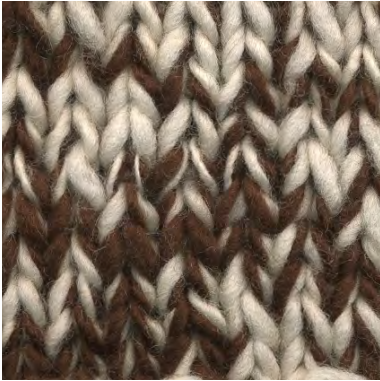
MCL-2247 / MCL-2800

Manos del Uruguay Wool Clasica - CHESTNUT MCL-2247 100% fairtrade handgesponnen wol garen mix van semi uni en melange kleuren.