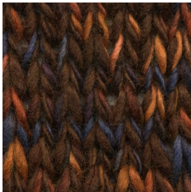
MCL-2247 / MCL-6554