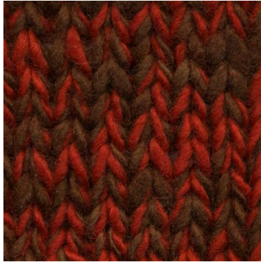
MCL-2247 / MCL-2106