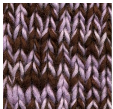
MCL-2247 / MCM-2615

patronen wol en materialen voor breiers met pit