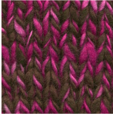
MCL-2247 / MCL-5003