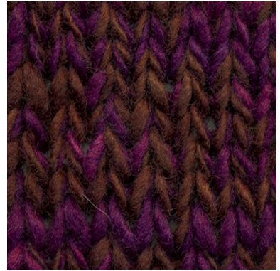
MCL-2247 / MCL-2665