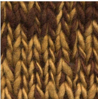
MCL-2247 / MCL-2264