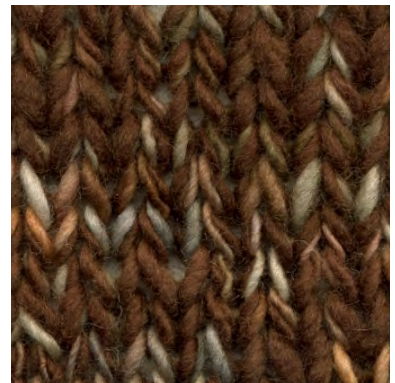
MCL-2247 / MCL-8891