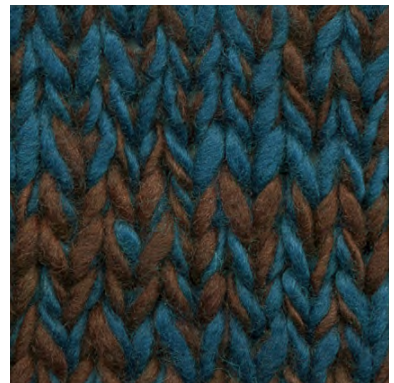
MCL-2247 / MCL-2444