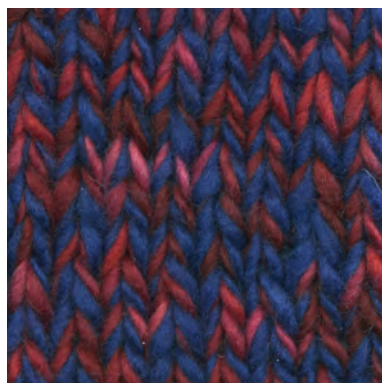
MCM-6422 / MCL-2450