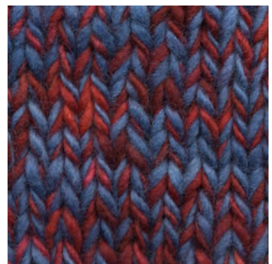
MCM-6422 / MCM-2412