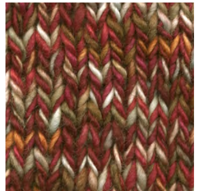
MCM-6422 / MCL-6554