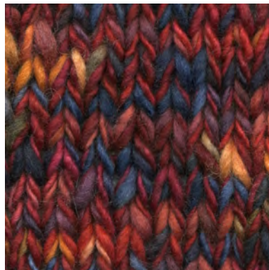
MCM-6422 / MCL-6422