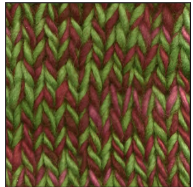
MCM-6422 / MCL-2364