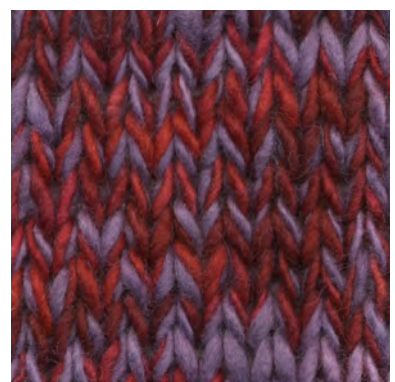
MCM-6422 / MCM-2672

patronen wol en materialen voor breiers met pit