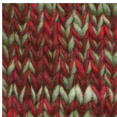
MCM-6422 / MCM-2302