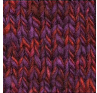
MCM-6422 / MCL-2665