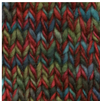
MCM-6422 / MCL-7311