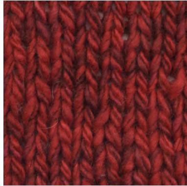
MCM-6422 / MCL-2106