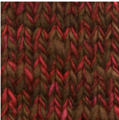
MCM-6422 / MCL-2247