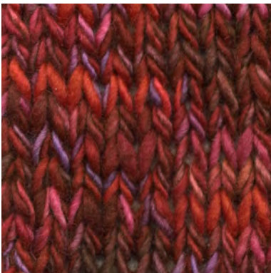
MCM-6422 / MCL-7032