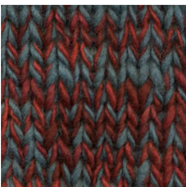
MCM-6422 / MCM-2370