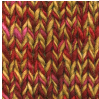
MCM-6422 / MCL-2264