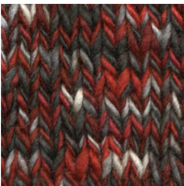
MCM-6422 / MCL-3891