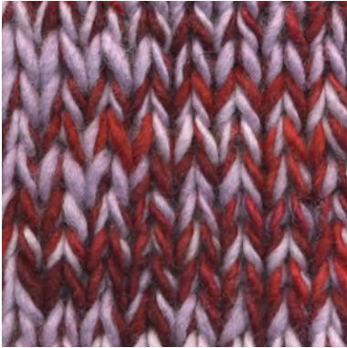
MCM-6422 / MCL-2615

Manos del Uruguay Wool Clasica - ROZE'S MCM-6422 100% fairtrade handgesponnen wol garen mix van semi uni en melange kleuren.