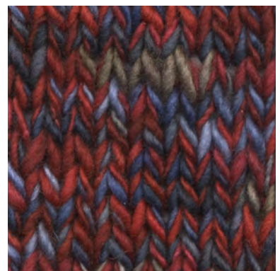
MCM-6422 / MCM-7073

patronen wol en materialen voor breiers met pit