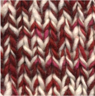
MCM-6422 / MCL-2800

Manos del Uruguay Wool Clasica - ROZE'S MCM-6422 100% fairtrade handgesponnen wol garen mix van semi uni en melange kleuren.