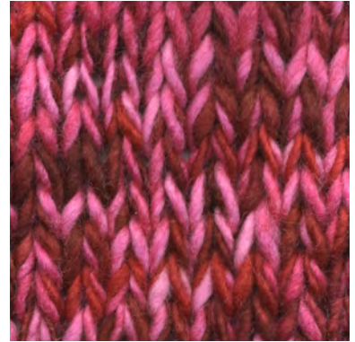
MCM-6422 / MCL-5003