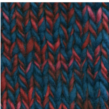
MCM-6422 / MCL-2444