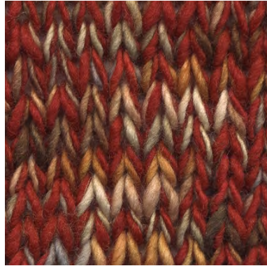
MCM-8891 / MCL-2106