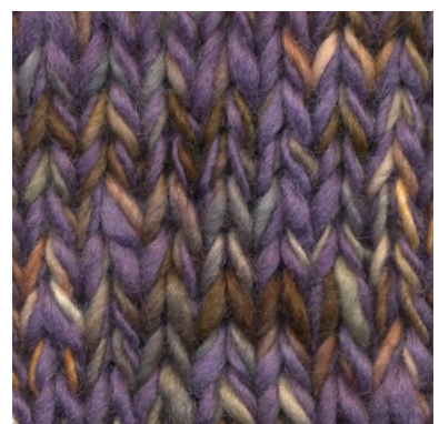
MCM-8891 / MCM-2672

patronen wol en materialen voor breiers met pit