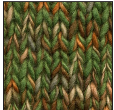
MCM-8891 / MCL-2364