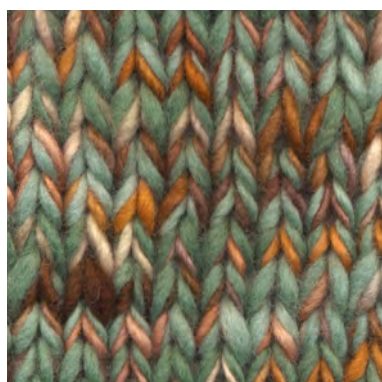
MCM-8891 / MCM-2302