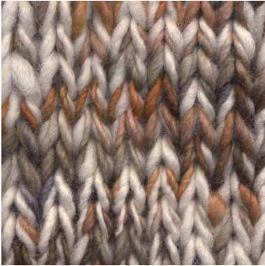
MCM-8891 / MCL-2800

Manos del Uruguay Wool Clasica - AUTUMN MCM-8891 100% fairtrade handgesponnen wol garen mix van semi uni en melange kleuren.