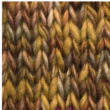
MCM-8891 / MCL-2264