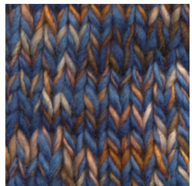
MCM-8891 / MCM-2412