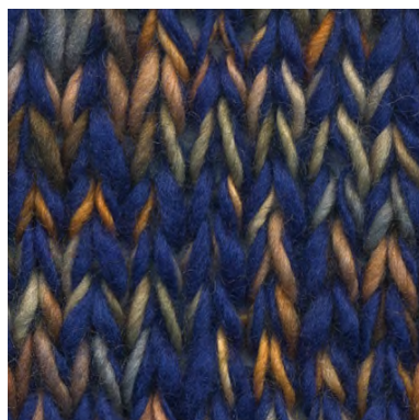
MCM-8891 / MCL-2450