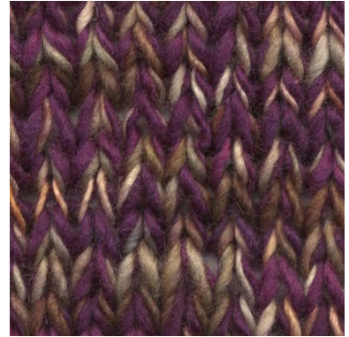
MCM-8891 / MCL-2665