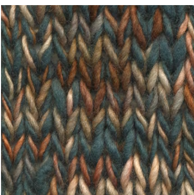
MCM-8891 / MCM-2370