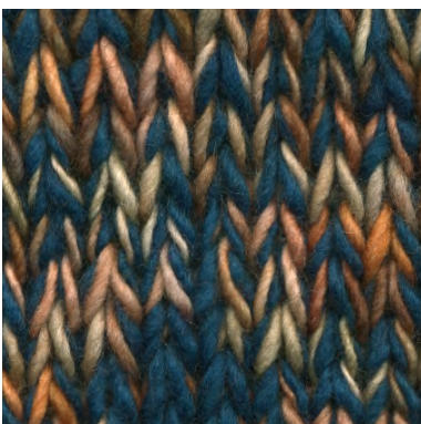
MCM-8891 / MCL-2444